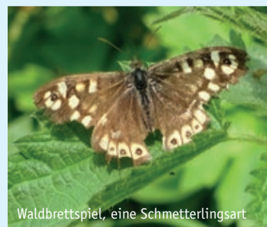
Waldbrettspiel, eine Schmetterlingsart

ma verändert, denn dann müssen sie ihre Strategie anpassen. Viele Vögel ziehen im Herbst ans Mittelmeer und gleich nach Afrika südlich der Sahara. Dabei ist ihnen nicht kalt, aber sie finden im Winter hier nichts mehr zu fressen. Zugvö-