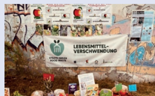
Infos zur Lebensmittelverschwendung sind wichtig

Wir, der Ernährungsrat Essen, sind ein Verein, in dem sich Menschen aus verschiedenen Berufen zusammengeschlossen haben, um diese Fragen zu beantworten und das Ernährungssystem in unserer Stadt Essen und der Region Ruhrgebiet zu verbessern und wieder naturnah zu gestalten. Wir wollen mehr essbare Pflanzen in unseren Gärten, Parks, auf Spielplätzen und Schulhöfen und besseres Essen in der Gemeinschaftsverpflegung. Leckeres, frisches, gesundes und fair gehandeltes Essen soll für alle bezahlbar sein, bei der Produktion sollen nirgendwo Menschen und Tiere leiden und es soll weniger CO 2 ausgestoßen werden. Deshalb müssen wir genau hinschauen, was wir kaufen und woher unser Essen kommt. Wie wurde es geerntet oder wie ist es gewachsen?