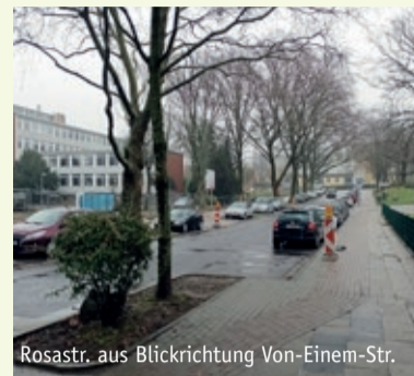
Rosastr. aus Blickrichtung Von-Einem-Str.

Vier Schulen liegen in Rüttenscheid sehr eng zusammen: das Helmholtz- und das Maria-Wächtler-Gymnasium an der Rosastraße, die Berta-von-Suttner Realschule an der Karolinenstraße und die Andreasschule an der Von-Einem-Straße. Eine Außenstelle der Maria-Wächtler-Schule auf der Isenbergstraße und ein gerade im Neubau befindliches Übergangsgebäude an der Rosastraße kommen auch noch dazu. Die Schulgelände grenzen fast alle unmittelbar aneinander. In diesem Bereich müssten gar keine Autos mehr fahren, nur ein