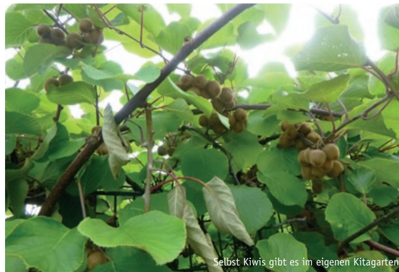
Selbst Kiwis gibt es im eigenen Kitagarten

Mit dem Umweltpreis 2023 wurden auch drei städtische Kitas mit dem Sonderpreis Fair Trade geehrt. „Der Gedanke des fairen Handels ist eng mit dem Schutz unserer Umwelt verknüpft, denn er fördert eine verantwortungsbewusste und ressourcenschonende Produktion“, so Umweltdezernentin Simone