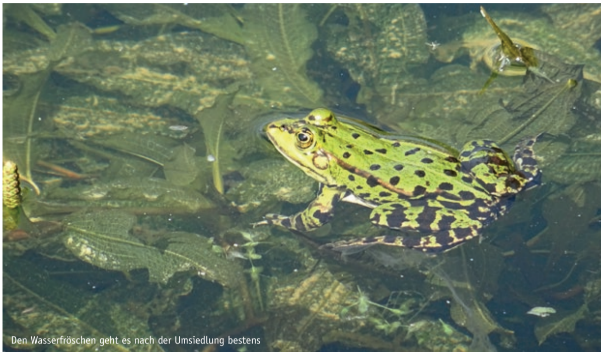
Den Wasserfröschen geht es nach der Umsiedlung bestens

Mit dem diesjährigen Motto „Essen achtet Wasser“ rücken wir ein besonders wichtiges Thema in den Vordergrund – den Schutz unserer wertvollsten Ressource: Wasser.