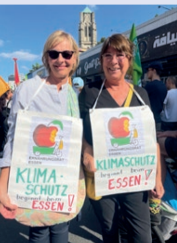
Mit viel Engagement bei der Sache

Aber wie erreichen wir das? Wir sprechen darüber mit vielen Lehrerinnen und Erzieherinnen, aber auch mit Politikerinnen, mit Menschen aus der Stadtverwaltung und der Landwirtschaft, aber auch mit Bäckerinnen und Metzgerinnen. Es ist eine große Aufgabe, bei der alle helfen, Lösungen zu finden! Außerdem sind wir bei vielen Veranstaltungen dabei, zum Beispiel beim „Gutes Klima Festival“ auf der Zeche Carl am Samstag, den 31. August 2024.