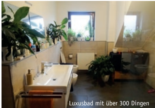
Luxusbad mit über 300 Dingen

Wissenschaftler haben dazu in Deutschland geforscht und sind zu dem Ergebnis gekommen, dass jeder Mensch in Deutschland im Durchschnitt rund 10.000 Dinge besitzt. Dazu zählen natürlich nicht nur große und teure Dinge wie ein Auto, die Möbel, ein Fahrrad oder das Smartphone. Die Masse der Dinge sind kleine und günstige Sachen wie Klamotten, Spielzeug, Bücher, Stifte, Dekomaterial und vieles andere mehr. Benötigt man aber tatsächlich so viele Sachen? Auch dazu gibt es Untersuchungen und die zeigen,