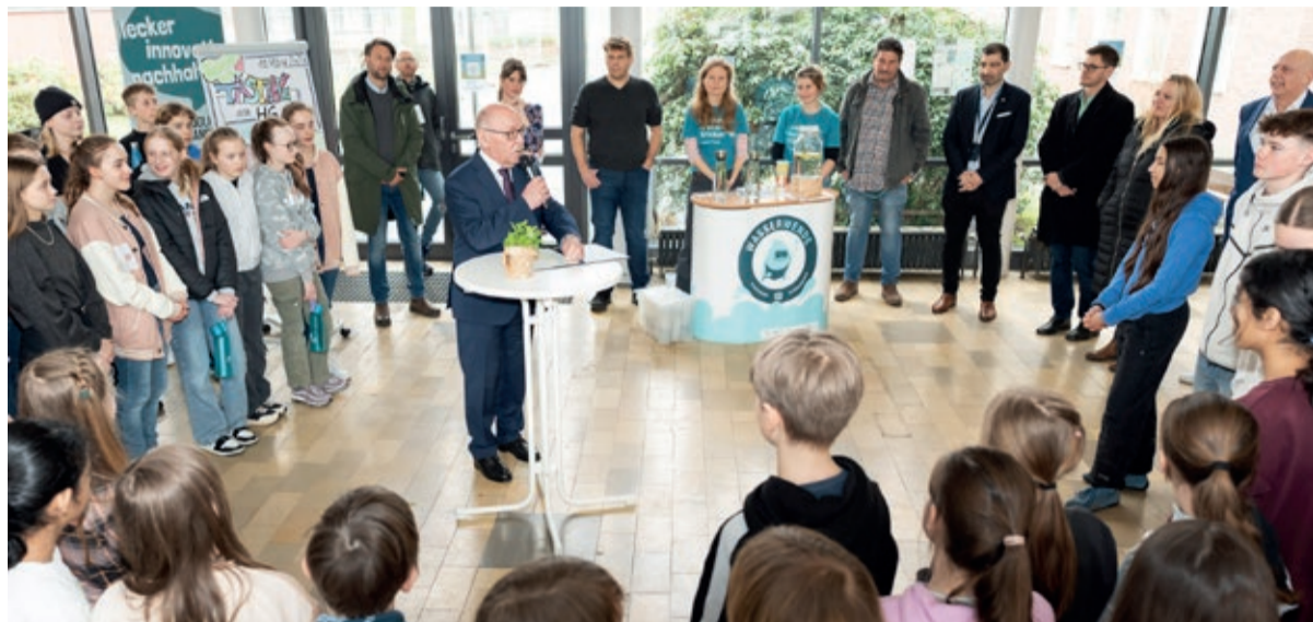
Essen ist dabei: Das Projekt „SchoolFood4Change“ läuft in 12 Ländern Europas

Das Projekt SchoolFood4Change (übersetzt: Schulverpflegung im Wandel) will die Verpflegung in Schulen und Kindertagesstätten verändern. Deutschland ist als eines von zwölf Ländern in Europa auch dabei!