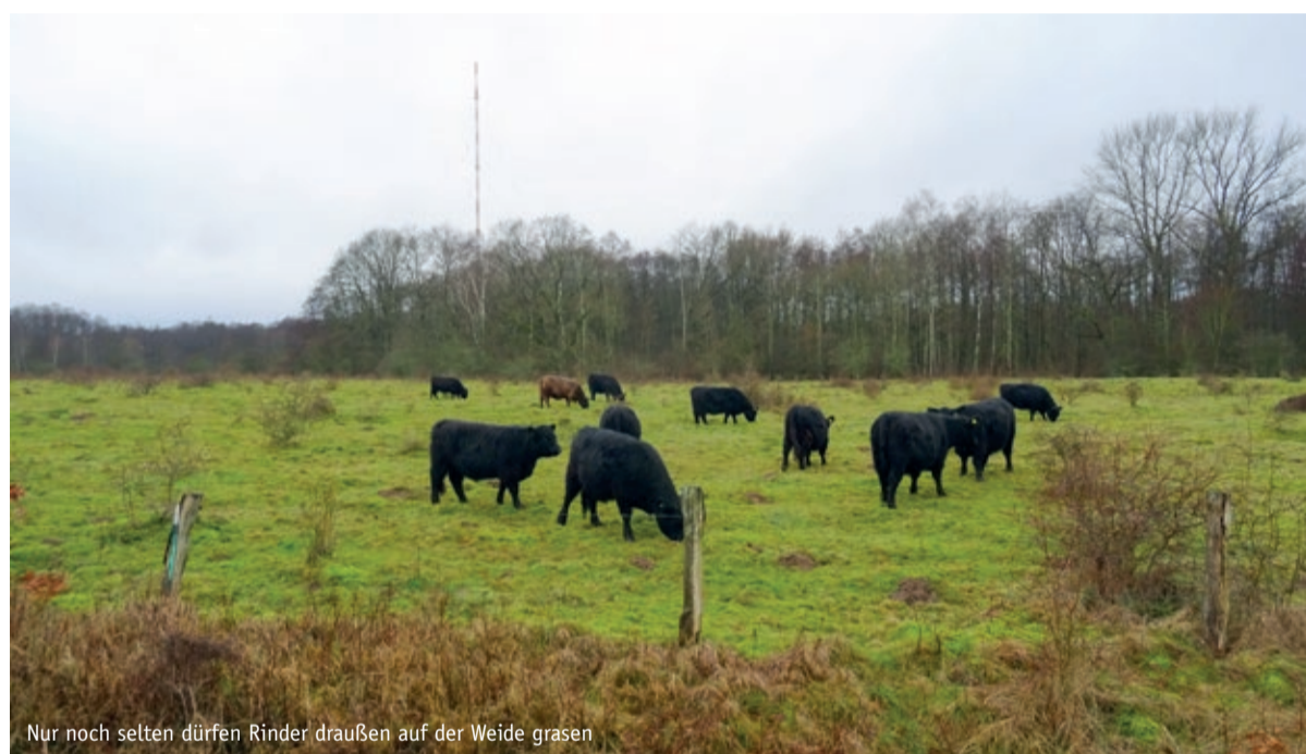
Nur noch selten dürfen Rinder draußen auf der Weide grasen