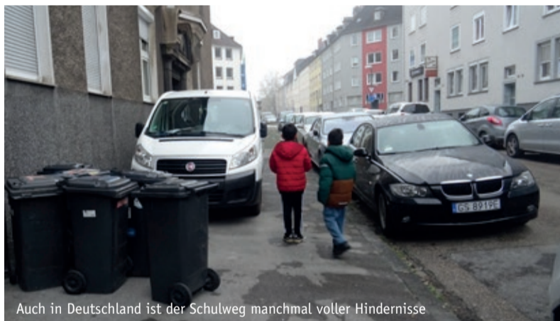
Auch in Deutschland ist der Schulweg manchmal voller Hindernisse

Auch mit dem Fahrrad oder dem Roller zur Schule zu kommen, ist eine gute und sichere Möglichkeit. In verschiedenen Übungen mit der Polizei werden wir ab der Grundschule für einen sicheren Schulweg sogar richtig fit gemacht! In Deutschland gibt es auch sogenannte „Elterntaxis“, die kritisch gesehen werden müssen, da sie leider dazu führen, dass Kinder gar keinen eigenen Weg antreten müssen. Dass diese Art des Schulweges nicht selbstverständlich ist, zeigt ein Blick nach Peru, einem Land in Südamerika.