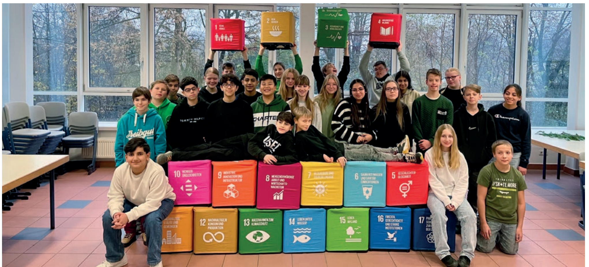
Klasse 7b der Gesamtschule Holsterhausen: Nur gemeinsam erreichen wir die Nachhaltigkeitsziele

Die Vereinten Nationen (UN) haben ein weltweites Programm mit 17 Zielen entwickelt. Sie sollen es allen Menschen ermöglichen ein menschenwürdiges und glückliches Leben zu führen.