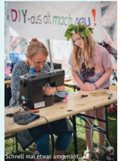
Schnell mal etwas umgenäht...

Es ist viel klüger, wenn man die Sachen verschenkt, verkauft oder spendet. Dies ist zum Beispiel auf verschiedenen Onlineportalen möglich. Das geht ganz einfach: Ein Foto hochladen und den Preis bestimmen. So findet man Interessenten und andere erfreuen sich beim Kauf daran, dass sie ein Schnäppchen gemacht haben. Eine andere Möglichkeit, seine alten Sachen „loszuwerden“, ist ein Stand auf dem Flohmarkt. Dort kann man außerdem stöbern und sich selbst etwas schönes Gebrauchtetes kaufen.