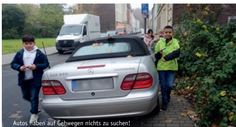
Autos haben auf Gehwegen nichts zu suchen!

In einer dieser Zusammenarbeiten ist in der Nachbarstadt Gelsenkirchen eine spannende Idee entwickelt worden. Alle Kinder einer Klasse, einer Stufe oder der ganzen Schule kopieren sich kleine Zettel, auf denen sie auf ihre schwierige Situation aufmerksam machen und heften diese unter die Scheibenwischer von Falschparkern. Unterschrieben sind diese kleinen Karten mit „Liebe Grüße von den Kindern aus ihrem Quartier“. Wir sind gespannt, ob sich einige Autofahrer ihrer Gefährdung bewusst werden und demnächst weniger Autos auf den Gehwegen stehen.