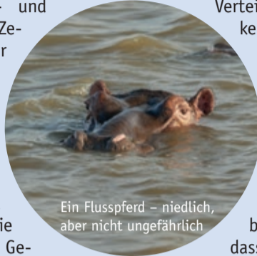
Ein Flusspferd – niedlich, aber nicht ungefährlich

Wahrscheinlich leben hier inzwischen mehr Großtiere, als auf allen anderen Kontinenten zusammen. Hier gibt es Dutzende von Antilopen- und Gazellenarten, Zebras, Nashörner und Elefanten. Und es gibt auch noch jede Menge große Raubtiere. Die wichtigsten sind die Löwen, die Leoparden, die Geparden und die Hyänen.