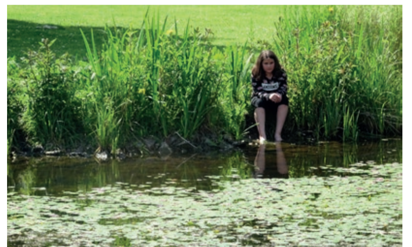
An manchen Stellen im Oberlauf der Emscher ist es idyllisch geworden

Dieser Fluss war bis vor ein paar Jahren kein richtiger Fluss mehr, hier flossen nur Abwässer. Fische, Amphibien oder anspruchsvolle Wasserinsekten lebten hier nicht. Deshalb machte es sich die Genossenschaft zum Ziel, ihn zu säubern. So baute sie zum Beispiel spezielle Konstruktionen wie unterirdische Becken und Klärwerke, um das Wasser zu reinigen. Das dauerte bis 2020 und war mit viel Arbeit verbunden. Als die Arbeiten fertig waren, wurde nicht nur die Natur besser, sondern auch das Leben der Leute um den Fluss herum wurde schöner. Mittlerweile fließt seit zwei Jahren kein Dreck mehr in die Emscher, was sich positiv auf die Tier- und Pflanzenwelt auswirkt. Experten zählen mittlerweile 820 verschiedene Arten, die sich im und am Wasser angesiedelt haben. Neben Vögeln wie dem Austernfischer oder dem Baumfalken, ist die sogenannte „Blauflügelige Prachtlibelle“ ein besonderer Stolz aller Beteiligten des Projekts. Diese Libellenart ist sehr anspruchsvoll