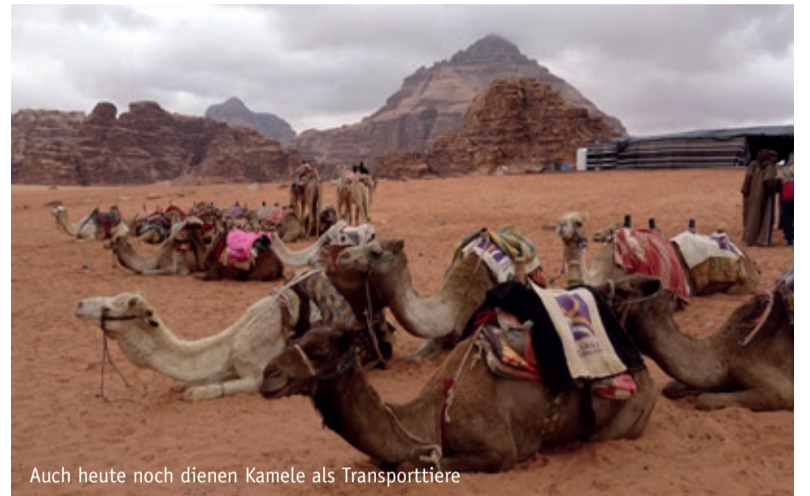
Auch heute noch dienen Kamele als Transporttiere

Tanker und Containerschiffe, so lang wie vier Fußballplätze, durchkreuzen heute die Weltmeere.