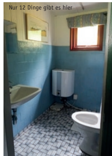
Nur 12 Dinge gibt es hier

Mach dir doch mal Gedanken, wie viele Dinge du selbst besitzt und ob du sie wirklich brauchst. Und welche wären die 100 Dinge, die du auf keinen Fall verlieren möchtest. Oder kommst du vielleicht sogar mit nur 50 Dingen aus?