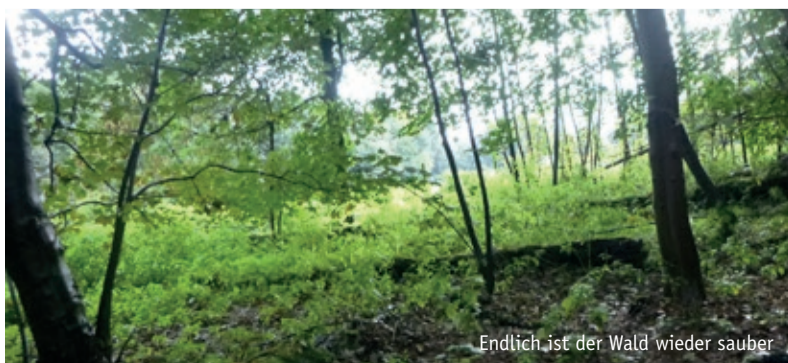
Endlich ist der Wald wieder sauber