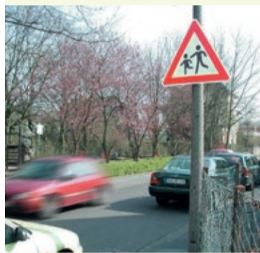
Parkende Autos behindern die Sicht