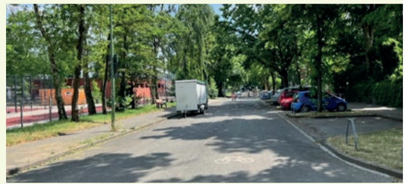
Bereich rund um das Maria Wächtler und Helmholtz Gymnasium